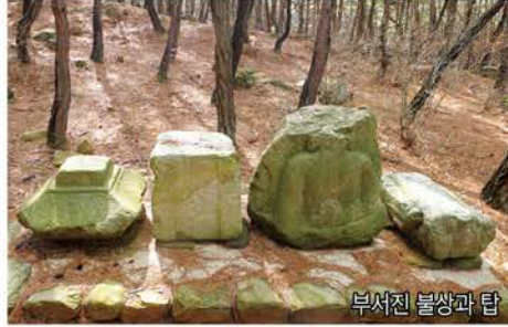
부서진 불상과 탑