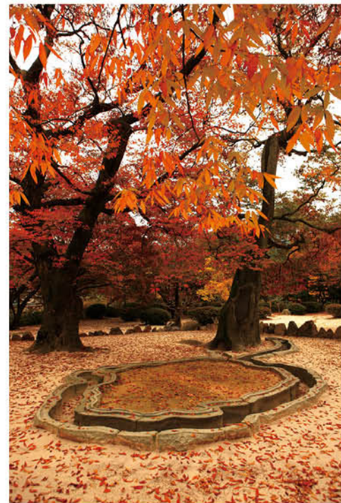
경주시 남산순환로 816

구불구불한 돌 홈 사이에 물을 흐르게 하고 그 위에 술잔을 띄웠다는 것은 제례 의식을 행하던 것으로 추정될 수 있다. 유상곡수의 연회는 353년 3월 중국 동진의 나정에서 왕희지가 행했던 기록이 있으나, 동양 삼국에서 남아 있는 유상곡수의 흔적은 포석정 유구가 가장 오래되었다.