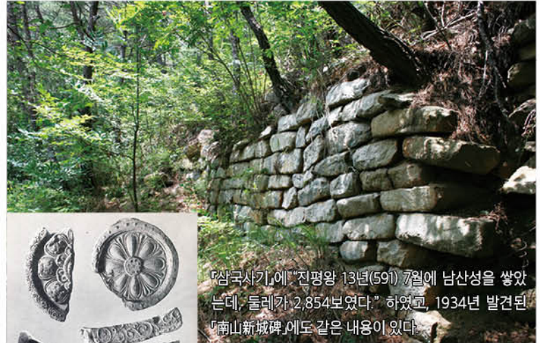
『삼국사기』에 "진평왕 13년(591) 7월에 남산성을 쌓았는데, 둘레가 2,854보였다." 하였고, 1934년 발견된 『南山新城碑』에도 같은 내용이 있다.